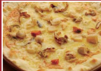
タラコとホタテのピザ