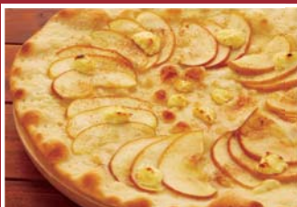
アップルスィーツピザ