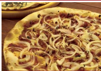
唐辛子とオニオンガーリック