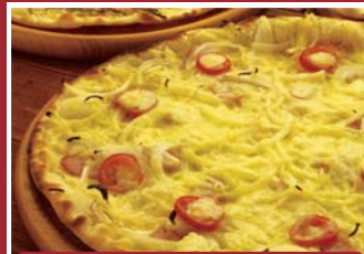
オニオンソーセージ