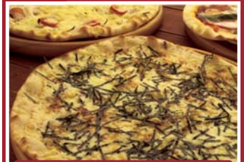
長芋とニンニクの和風ピザ